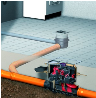
Przykład zabudowy zaworu Pumpfix F Komfort