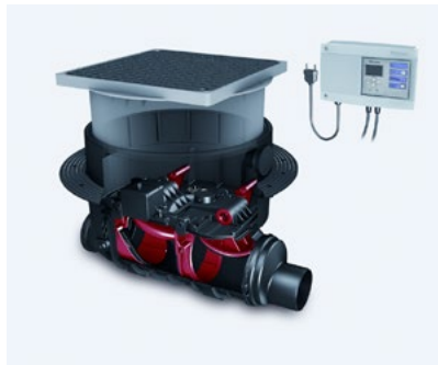
Automatyczny zawór zwrotny Staufix FKA Komfort