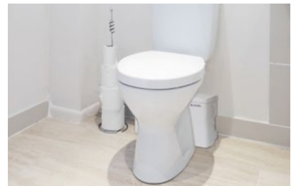
Pomporozdrabniacz Minilift F

Pomporozdrabniacz Minilift F odprowadza ścieki z WC w pomieszczeniach poniżej poziomu zalewania lub w razie braku wystarczającego spadku do najbliższego kolektora ściekowego. Wyposażony jest w niezawodny mechanizm rozdrabniający SharkTwister , który skutecznie rozdrabnia papier toaletowy i ścieki z domowych sanitariatów. Bezpośrednie przyłącze do WC umożliwia montaż urządzenia tuż za toaletą, dzięki czemu nie jest potrzebna dodatkowa przestrzeń na jego ustawienie.