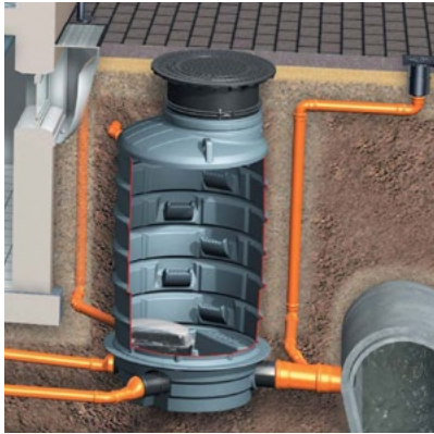
Przydomowa studzienka przeciwzalewowa z polietylenu wyposażona w zawór zwrotny z pompą Pumpfix F